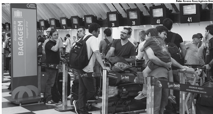
Atualmente os passageiros podem despachar itens com até 23 quilos em voos nacionais e dois volumes de até 32 quilos cada em viagens internacionais

As concessionárias também deverão fazer melhorias imediatas nos terminais, como revitalização e atualização de sinalizações e de sistema de iluminação, ofereci-