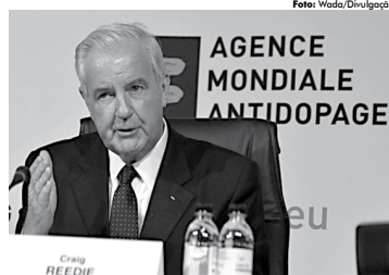
O presidente da Wada, Craig Reedie, espera mais comprometimento da Rússia

Reedie disse que a Rusada adotou medidas para voltar a cumprir as normas, mas que é preciso fazer mais. "Ainda existe um trabalho significativo para (a Rusada) fazer. Ela deve demonstrar que seus processos são autônomos e independentes de interferência externa", disse Reedie durante um encontro internacional.