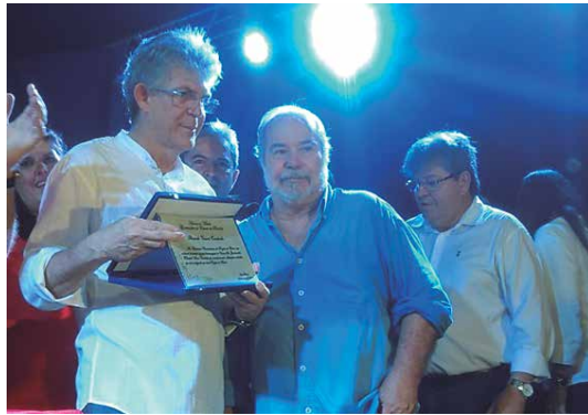
Governador Ricardo Coutinho recebe homenagem dos moradores ao inaugurar o Parque Linear Parahyba que abrange os bairros do Aeroclube, Bessa e Jardim Oceania