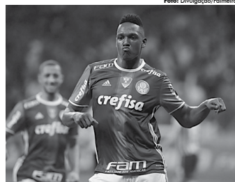
Borja não treinou ontem mas deve jogar contra o time boliviano

Sem contar com o lateral direito Fabiano e o centroavante Miguel Ángel Borja, poupados da atividade, o treinador palmeirense ensaiou saída de bola e jogadas a partir dos zagueiros; o setor mais defensivo contará neste meio